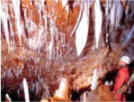
Grotte de Poussilière (Hérault), Salle du Téléphone