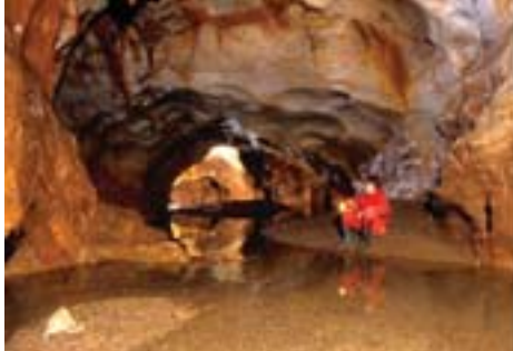
Grotte du PN77 (Hérault) - Galerie du siphon