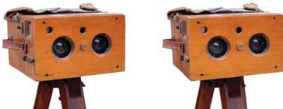
Stirn detective stéréo 1890

Ce numéro en couleurs étant consacré en priorité à l'image, la suite de l'article d'André Gardies « Qu'est-ce qu'est une belle photo en relief ? » est reportée à un prochain numéro.