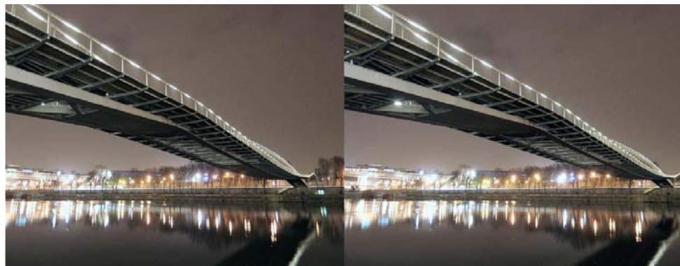
La nouvelle passerelle Simone de Beauvoir à Paris