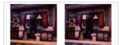
Collection du musée de Saint-Rémy-de-Provence