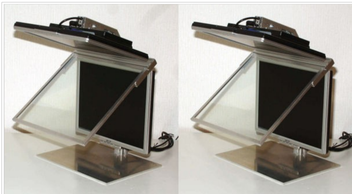
L'écran Samuel Bühlmann La précision suisse !

Les deux écrans sont identiques, des LCD Philips Brilliance 170S9 – TFT – 17" de diagonale. La résolution est de 1280 x 1024 pixels – Format SXGA. Le temps de réponse est de 5 ms. La luminosité est plutôt bonne, 300 cd/m 2 . Ils offrent deux possibilités d'entrée du signal vidéo : VGA et DVI-D. Le miroir semi