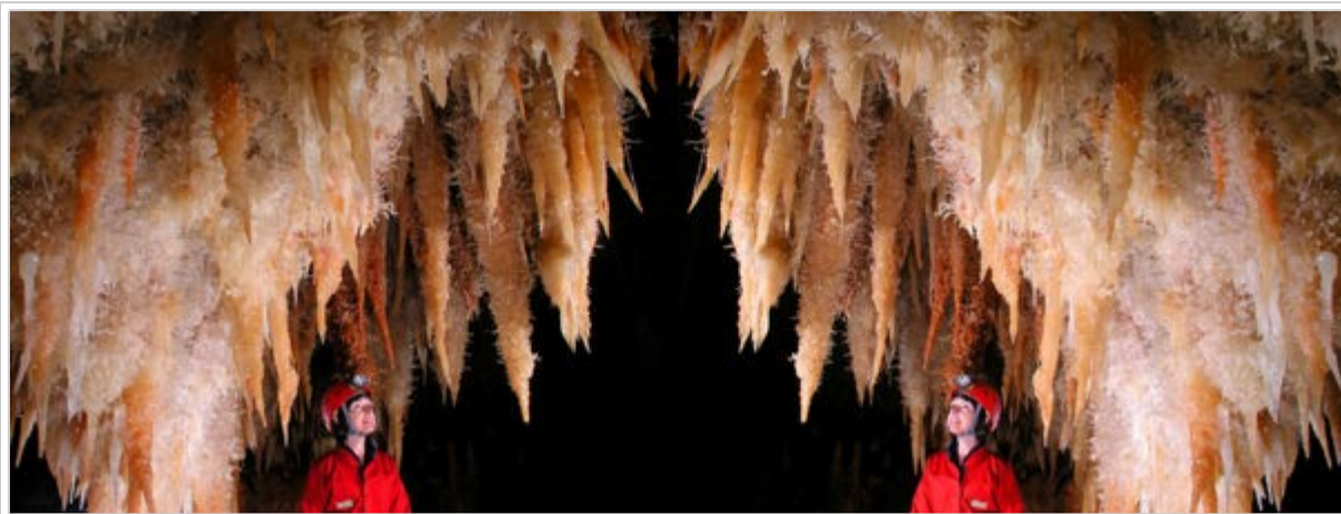
Pour les besoins de la diffusion, l'image droite a été 'mirorée' Grotte d'Armédia - Gard

Compte tenu de la position et de l'orientation de l'écran supérieur, l'image droite doit être "mirorée". Pour ce faire et selon le logiciel audiovisuel utilisé pour diffuser les images, on interviendra soit à la création des couples avec StereoPhoto Maker ou juste avant la diffusion avec MyAlbum.