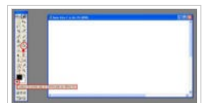
Une fenêtre blanche apparaît. Elle correspond à une zone de travail de 2800 x 1050 px