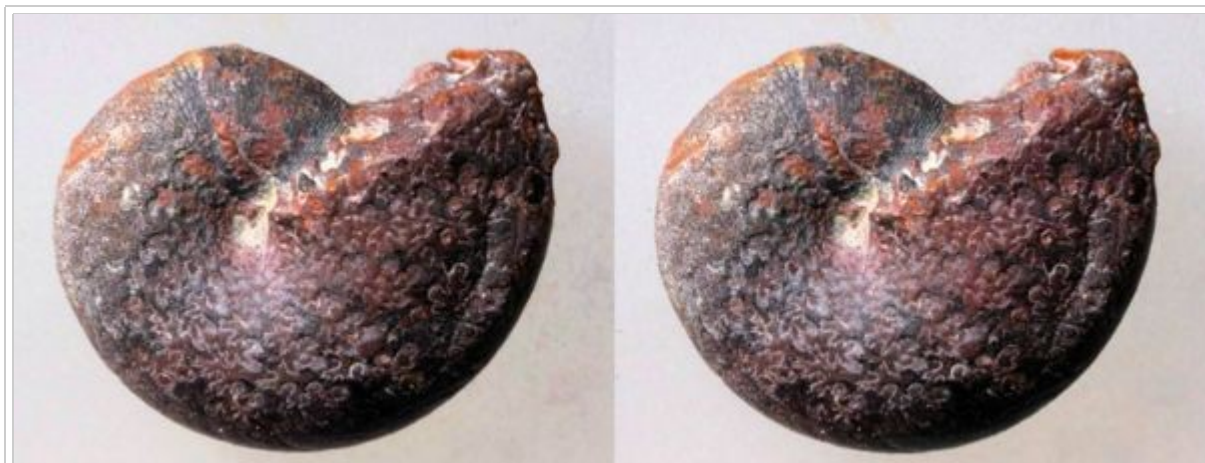
Résultat du traitement des deux séries de 6 images Gauche et droite Assemblage des images obtenues à l'aide du logiciel StereoPhotoMaker Taille de la petite ammonite : environ 7 x 5 mm

Pour faire deux séries d'images, le support est décalé cette fois en X, une fois le décalage en Y effectué, sans toucher au grandissement. Les deux séries d'images sont ensuite traitées chacune avec le logiciel de "stacking", et les résultats de ces deux "fusions" sont ensuite assemblés à l'aide du logiciel StereoPhoto Maker.