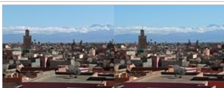
Marrakech, terrasse du musée de la photographie, vue sur l'Atlas (en hyperstéréoscopie).