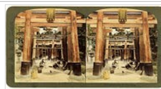
Kyoto- temple d'Inari, début 20e (T.Enami)

Pour en voir plus sur Yoshino * [1] ( http://... )