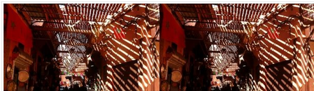
Marrakech- une allée couverte dans le marché (souk)