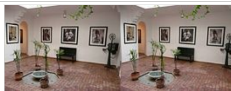
Marrakech, Patio du musée de la photographie. La petite salle à gauche montre un stéréoscope et des plaques de clichés doubles, hélas non visionnables.