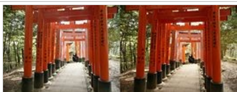
Kyoto- temple d'Inari, 2010