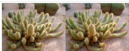
Villa Majorelle- Cactus

Marrakech – Villa Majorelle, souks et musée de la photographie. Ce dernier, l'un des rares lieux de mémoire visuelle du Maroc est peu fréquenté. Pourtant autant par son contenu que par son emplacement et le panorama qu'il offre sur la ville et la chaîne de l'Atlas, c'est un lieu magique.