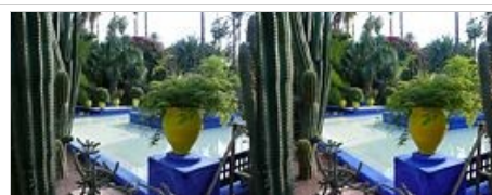
Villa Majorelle- la fontaine