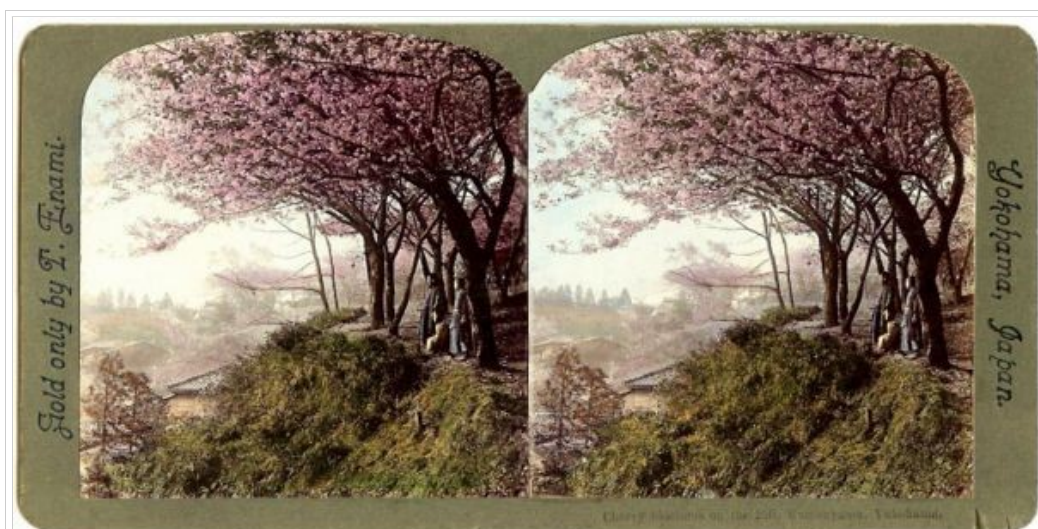
Printemps à Yokohama, début 20e (T. Enami)