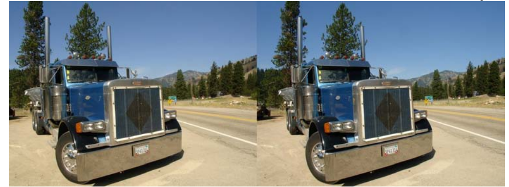
Les gros camions pleins de chrome, une certaine image de l'Amérique !

Retrouvez le calendrier des activités du Club sur Internet : www.stereo-club.fr/calendrier.php