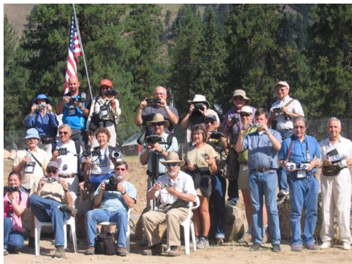
Photo souvenir lors d'une excursion au Congrès ISU de Boise.

(1) NDLR : Les organisateurs ont depuis mis sur le site de la NSA la liste des participants récupérable sous la forme d'un fichier Excel http://2007.nsa3d.org