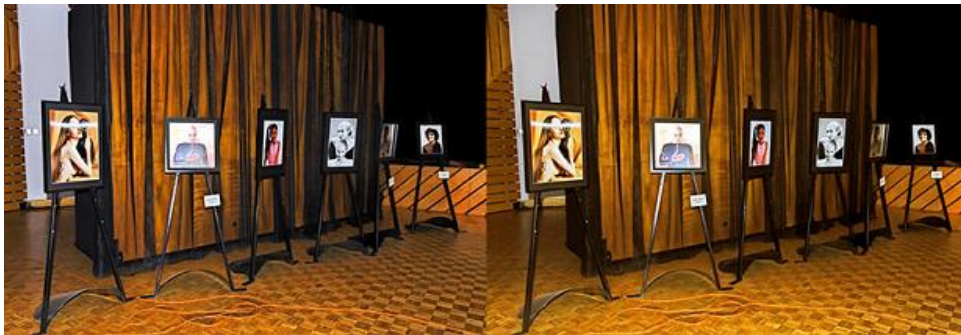
Une partie des lenticulaires d'Henri Clément - Photo : Pierre Gidon

Je débarquais donc le 18 octobre en plein après-midi avec mes anaglyphes en grand format dans le coffre de ma voiture.