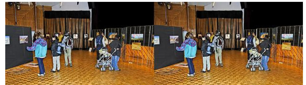
Les visiteurs devant les anaglyphes et phantogrammes

Le lendemain le public était peu nombreux. Un journaliste des DNA (Dernières Nouvelles d'Alsace) nous a posé quelques questions. Certains visiteurs posaient aussi des questions, mais c'était calme. La soirée avait pour point d'orgue un exposé du professeur Grosmann secondé par Bernard Kress, Directeur des optiques Numériques à SBGlabs Sunnyvale Californie.