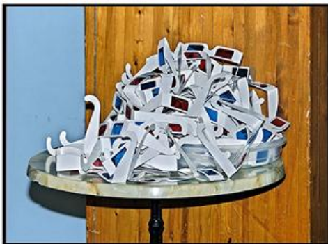
Le symbole de la réussite ? Les tas de lunettes usagées