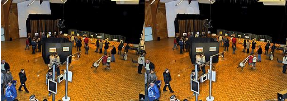
Une vue de haut de l'exposition

L'après-midi nous retrouvons le grand public, il est plus nombreux les enfants re-