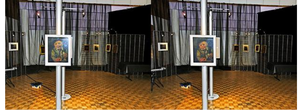
Un Synfogram de Syn4D devant les hologrammes

2 000 images. Les images sont celles d'un film vidéo. Le Synfogram contient donc à la fois un relief stéréoscopique sans lunettes, la couleur et une animation temporelle à révéler par notre déplacement devant l'image. Les projections stéréo à