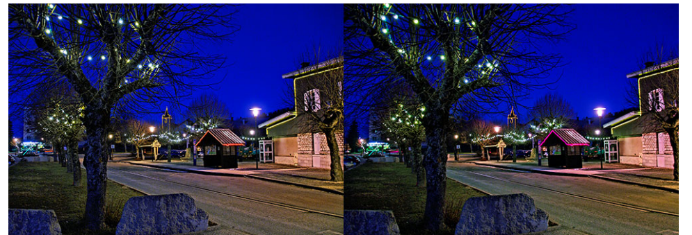
Saint-Nizier-du-Moucherotte (Vercors). Prise de vue à main levée, reflex numérique avec objectif à stabilisation, pose de 1/3 s.

Vous pouvez désormais corriger ce qui ne vous plaît pas dans vos photos : l'excès de contraste, le manque de luminosité, les couleurs trop jaunes (suite page 3)