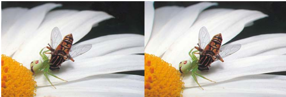
Capture d'un taon par une thomise « J'ai profité des quelques secondes d'immobilité du sujet pendant la paralysie de ce taon pour faire cette prise de vue. »