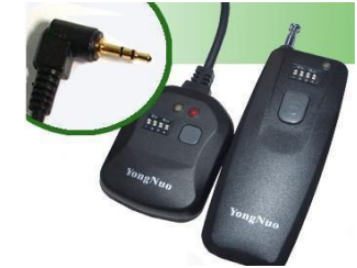
Autre modèle "Yong Nuo" à 20€ (Canon 350D, 400D)