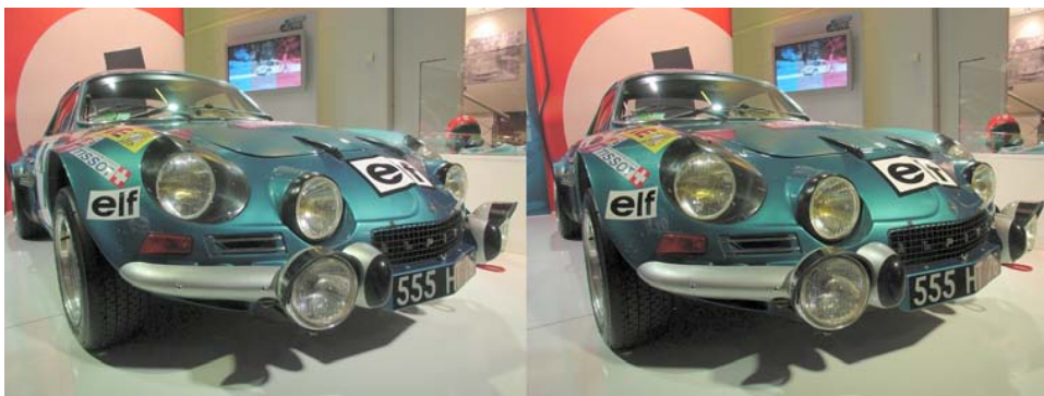
La Berlinette, la reine des Alpines. Exposition Alpine à Paris.

• Trois survols virtuels de montagnes réalisés à l'aide de Google Earth par Pierre Meindre.