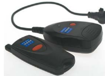
Modèle à 10€ (Canon 20D, 30D)

Les boîtiers reflex Canon disposent d'une prise télécommande, souvent une prise « jack » standard. Si on relie deux appareils par un câble connecté dans ces prises, on obtient une bonne synchronisation des déclenchements. Neil Nathanson a exploité avec succès ces prises en y reliant deux télécommandes radio sans fil : on règle les deux récepteurs sur la même fréquence et on utilise qu'un seul émetteur qui déclenche alors les deux appareils simultanément. Les hyperstéréoscopistes vont aimer la portée de 50m de ces télécommandes : en se mettant entre les deux appareils, une base stéréo de 100m est envisageable ! On trouve ces télécommandes à prix très raisonnable sur eBay : de 10 à 20€ (+ 16€ de port), chercher « télécommande sans fil Canon ». Vérifier que le type de prise correspond bien à son appareil.