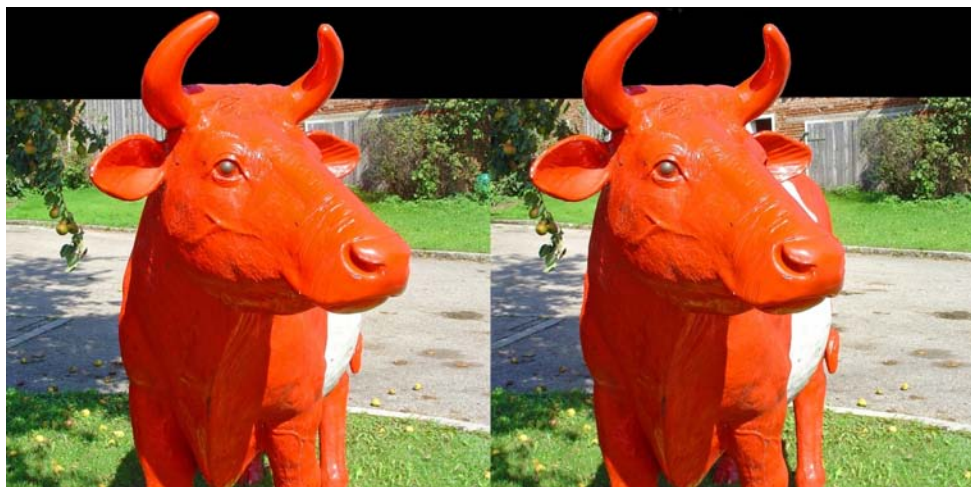
Une vache orange en Allemagne

Pierre Meindre nous propose trois séries d'images. En premier des macros de fleurs et mousses photographiées avec un Fuji W3 et l'adaptateur réducteur de base Cycloptical. Puis une série prise pendant les fêtes de Noël à Nancy et Stras-