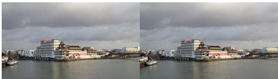
Confluent Seine-Marne juste à l'est de Paris, la Marne à gauche et la Seine à droite. Photo prise à Charenton-le-Pont sur la passerelle industrielle sur la Seine et qui mène à Ivry-sur-Seine. Les bâtiments pseudo-chinois juste sur la pointe du confluent sont le complexe Chinagora ouvert en 1992. À part l'hôtel restauré récemment, le reste est un peu en décrépitude... Prise en deux temps avec une base de 2,50 m environ.

Il s'agit d'un ouvrage d'érudition de belle facture. Après le rappel d'un beau texte d'Alexandre Ivanov intitulé Le stéréoscope (1905), bien connu des stéréoscopistes de l'ancien empire, et une brève histoire de la stéréoscopie, l'auteur analyse chacune des quatre séries : 1857, 1858, 1860 et 1870. Les reproductions de vues uniques ou doubles y sont abondantes et de qualité.