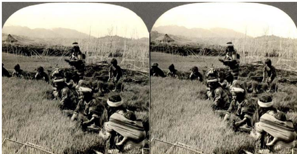
Culture du riz aux Philippines - Photo ancienne présentée par Thierry Mercier

Stéréo-Club Français Association pour l'image en relief fondée en 1903 par Benjamin Lihou