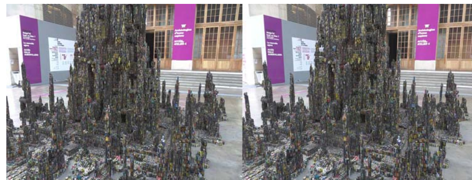
Sous la halle du Centquatre (établissement artistique et culturel à Paris) et dans le cadre de l'exposition "Jusqu'ici tout va bien ?", la sculpture monumentale de Krištof Kintera "Out of Power Tower" entièrement composée de piles usagées