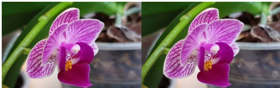
Fleur photographiée en deux temps avec un smartphone - Photo : François Lagarde