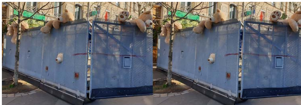
Les ours des Gobelins manifestent à Paris ! - Photo : François Lagarde

Pour voir en 3D, il y a des téléphones à écran autostéréoscopique, modèles souvent non suivis 1) . Il existe des coques autostéréoscopiques. On peut regarder une image côte à côte sur un écran assez grand ayant une bonne définition avec un binocle (par exemple : le OWL de la London Stereoscopic Compagny ).