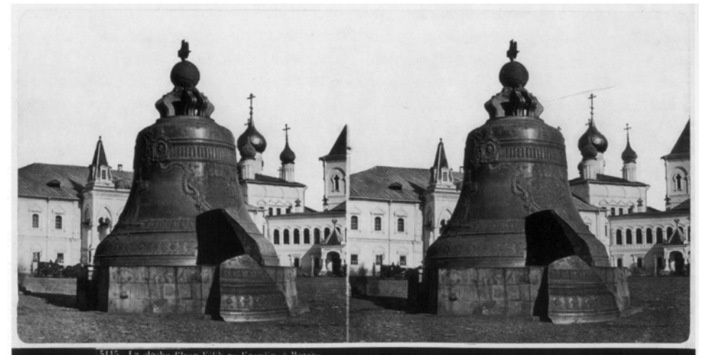
5115 La cloche d'Ivan-Velik au Kremlin, à Moscou