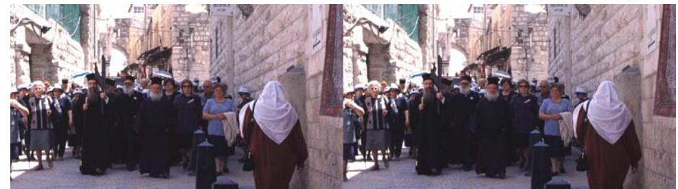
Procession de moines chrétiens orthodoxes (et aussi de touristes à gauche !) dans la vieille ville de Jérusalem, Israël