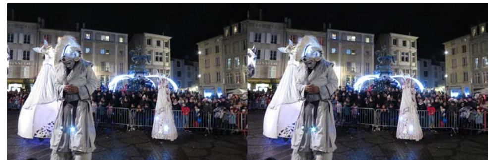
Défilé de Saint Nicolas à Nancy le 7 décembre 2019