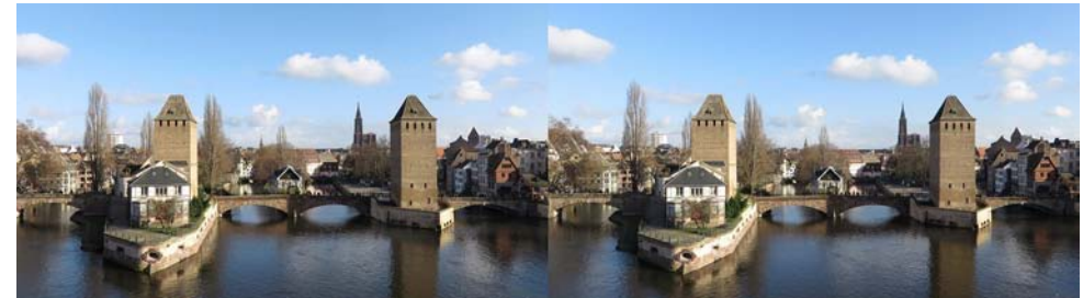
Les ponts couverts de Strasbourg dans le quartier de la Petite France - Photo : Pierre Meindre