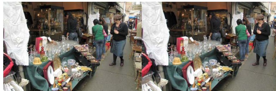
Promenade dans les ruelles du Marché Vernaison aux Puces de Saint-Ouen