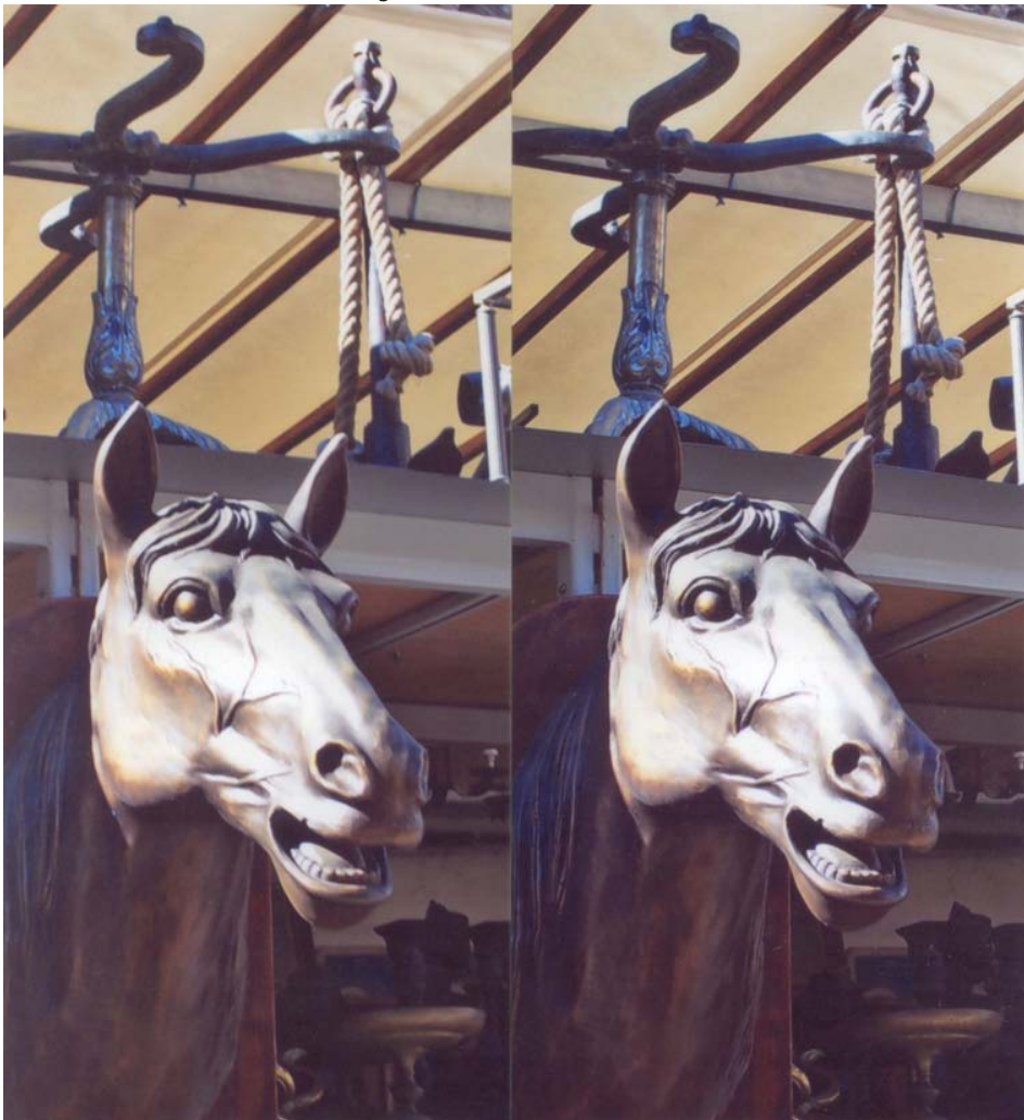
Une belle tête de cheval en vente aux Puces de Saint-Ouen

kitch, l'extravagant, l'onirique. On y trouve de vieilles machines à écrire, des meubles étranges ou tarabiscotés, des toiles psychopathologiques, des poupées anciennes, des Barbies, des barbichettes (postiches), des oiseaux nocturnes naturalisés plutôt déplumés par l'âge (les espèces sont protégées) et... une tête de cheval. D'autres "Puces" existent en