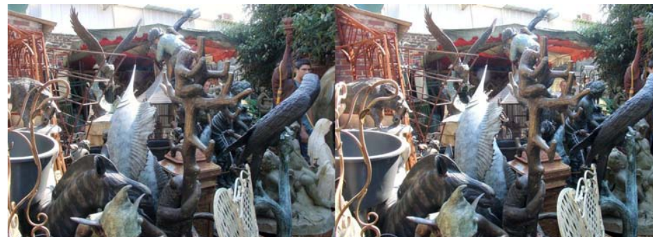
Un joyeux bric-à-brac chez ce vendeur des Puces de Saint-Ouen