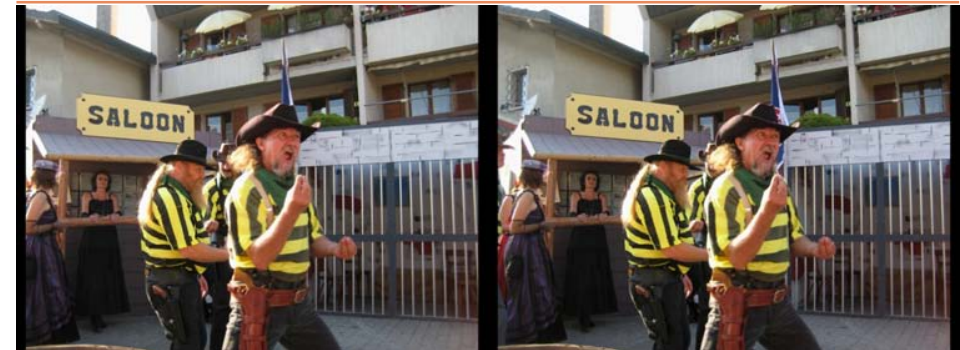
Le "far west" américain ? Non la Suisse !

Nom du compte : « Gmunden 2009 » N° du compte : 20044886501, Die ERSTE Bank : Code Banque 20111 Code IBAN AT66 2011 1200 4488 6501, Code BIC : GIBAAW