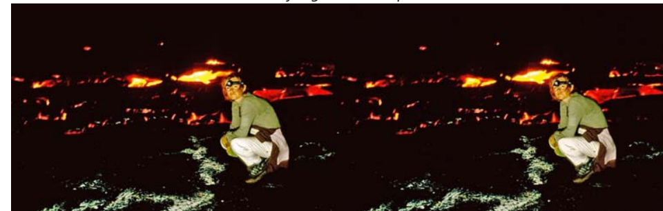
Les volcans d'Hawaii, parmi les plus actifs de la planète