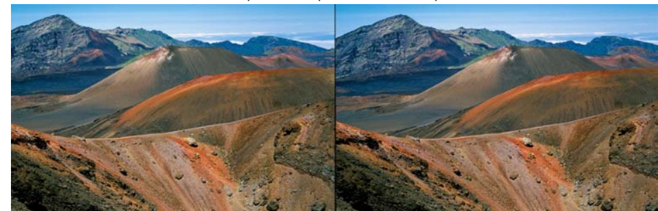
Paysages volcaniques à Hawaii