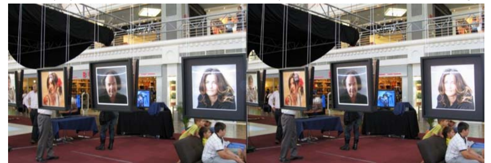
Les portraits lenticulaires d'Henri Clément exposés dans le centre commercial Balexert à Genève. Derrière, le stand "Nouvelles technologies" et les écrans 3D