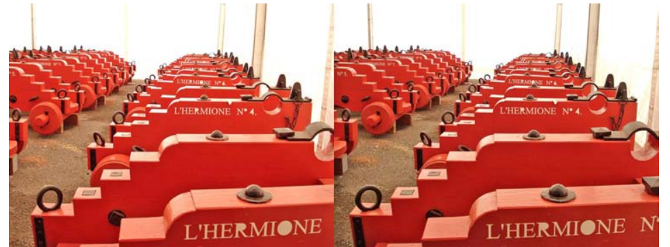
Les affûts de canon de l'Hermione