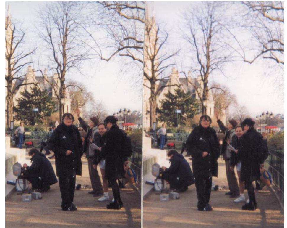
Le cinéaste Jean-Pierre Mocky en tournage près de Notre-Dame

Lorsque je l'ai aperçu, un matin d'hiver