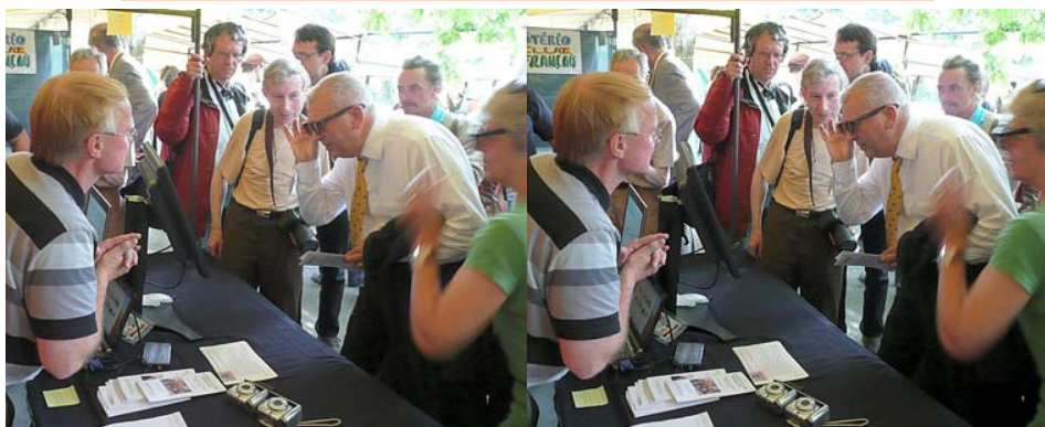
Oh ! c'est beau la stéréo ! Le stand du SCF à la foire à la photo de Bièvres

Bibliothèque (consultation des ouvrages et documents sur la stéréoscopie au Lorem) : Contactez Rolland Duchesne aux séances ou par mail.