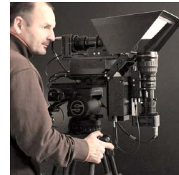
Caméra numérique stéréo à miroir semi-transparent de la société Binocle