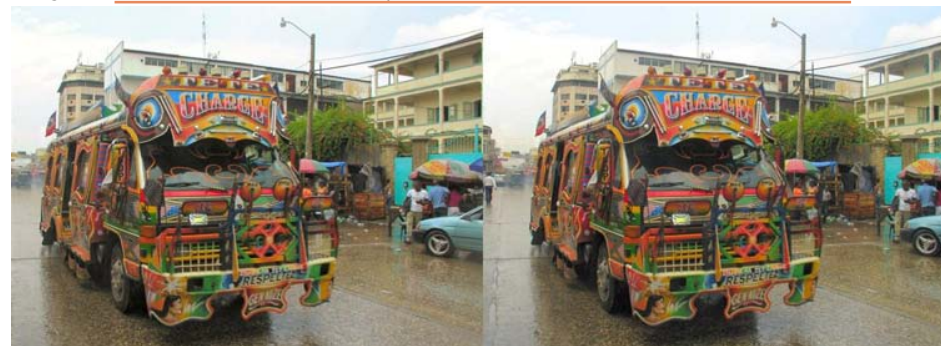
Les bus en Haïti et spécialement à Port-au-Prince la capitale sont probablement les bus avec la déco la plus démente qu'on puisse trouver ! Pare-chocs surdimensionnés, couleurs vives, slogans religieux peints un peu partout, des fenêtres aux formes bizarres et une grande fresque peinte à l'arrière (religieuse ou profane)