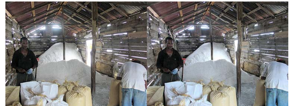
Récolte de sel, Montecristi, République Dominicaine