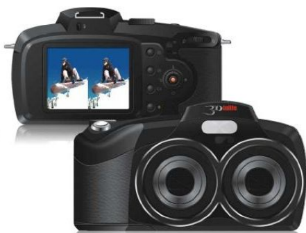
Image du futur appareil 3Dinlife HDC-810.

La même société 3Dinlife propose un cadre photo 3D dont les caractéristiques sont assez semblables au cadre Fuji. Bonne nouvelle :