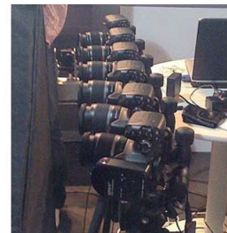
Série d'appareils synchronisés pour la photographie lenticulaire instantanée de la société Holoimage