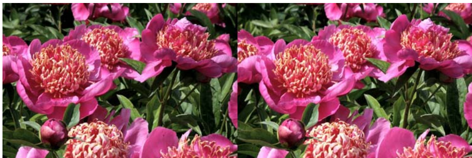
Pivoines