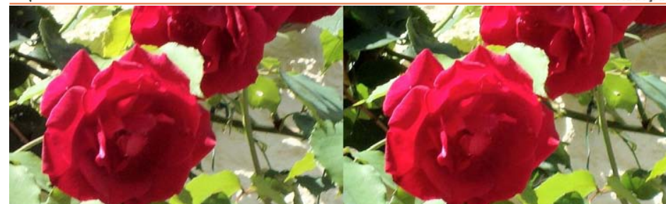
Roses, exemple c

Retrouvez le calendrier des activités du Club sur Internet : www.stereo-club.fr/SCFWiki/Calendrier