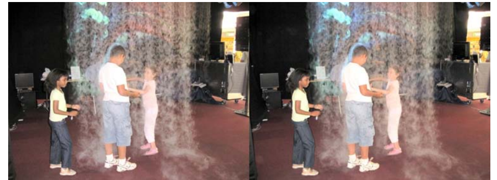
La projection sur écran d'eau amuse beaucoup les enfants !