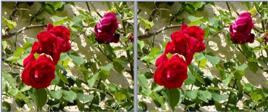
Roses, exemple a

Dans les trois cas, les pétales de roses sont rendus, si on les observe en projection