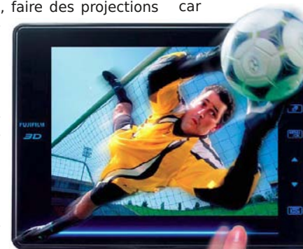
Vue d'artiste du cadre photo Fuji V1

Les logiciels fournis avec l'appareil semblent assez sommaires, il y a un utilitaire qui permet d'extraire les deux images gauche et droite d'un fichier MPO. Heureusement les développeurs indépendants ne sont pas restés inactifs : Masuji Suto a mis à jour StereoPhoto Maker pour les photos ainsi que StereoMovie Maker et StereoMovie Player pour la vidéo. SPM sait donc lire directement les fichiers MPO ce qui sera bien utile car l'appareil ne place pas convenablement la fenêtre stéréoscopique. Intéressant aussi : SPM sait générer un fichier MPO à partir d'un couple stéréo. On peut donc recharger ses images dans l'appareil (ou dans le cadre photo V1) mais aussi des images d'autres sources (pourquoi pas des diapos numérisées ?) pour les visualiser sur l'écran 3D intégré à l'appareil.