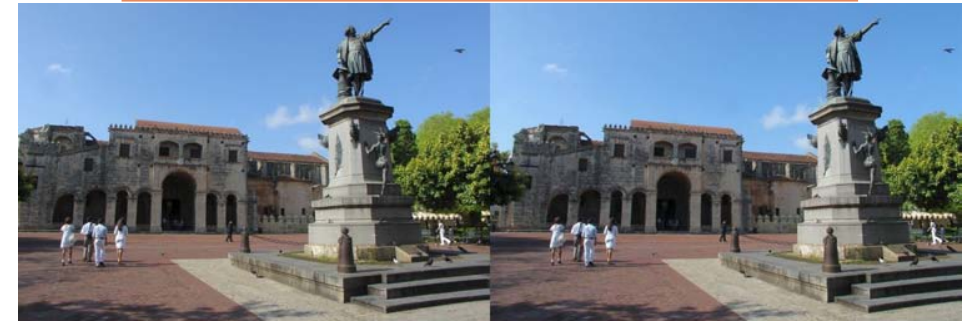
La statue de Christophe Colomb sur la place ... Christophe Colomb à Santo Domingo, la capitale de la République Dominicaine. Au fond la cathédrale "Santa Mariá la Menor", construite en 1514-40, c'est la plus ancienne des Amériques

Note : le dossier de presse du forum (28 pages, format PDF) est disponible à cette adresse : www.dimension3-expo.com/doc/Dossier_PRESSE_D3_09_260209.pdf