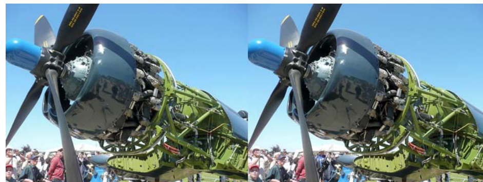
Ah ! En ce temps là, on savait faire des avions ! La Ferté-Alais