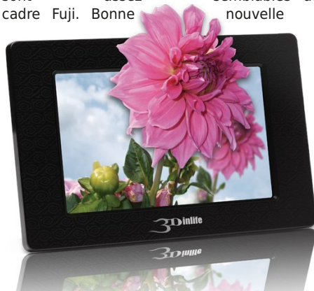
Cadre photo 3D