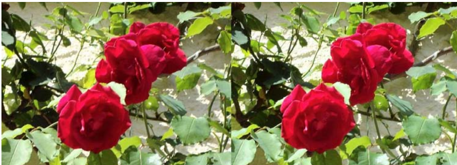
Roses, exemple b