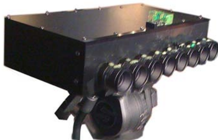
Une caméra numérique à 8 objectifs destinée l'enregistrement d'objets pour des publicités en relief sur écran Alioscopy

Qui seront les diffuseurs ? BskyB a fait un exposé volontariste mais souligne le manque de contenu. Canal+ n'a rien présenté mais avait commandé la conversion 2D->3D d'une course de chevaux. Orange a de grands rêves : tout passer en 3D. Eux c'est simple, ils veulent être des acteurs 3D dans la TV, le PC, le téléphone mobile et le cinéma. Ils appellent haut et fort à la création de contenu. Il leur faut au plus vite de quoi remplir plusieurs chaînes 24h/24. Ils avaient filmé, avec l'aide de Binocle, Roland Garros en 3D. Ils proposaient un jeu de tennis interactif sur TV Alioscopy. Ils démontraient le téléphone 3D Samsung SCH-B710. Ce téléphone est vendu en Asie et n'est pas adapté à la 3G européenne. Orange avait spécialement un émetteur