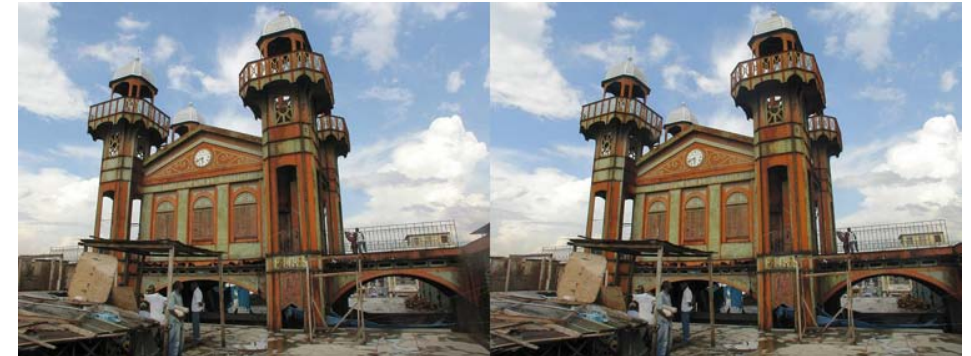
Sur le toit du "Marché de Fer", le grand marché couvert de Port-au-Prince, Haïti