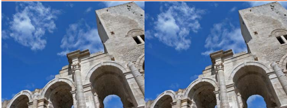
Le détour par Arles s'imposait !