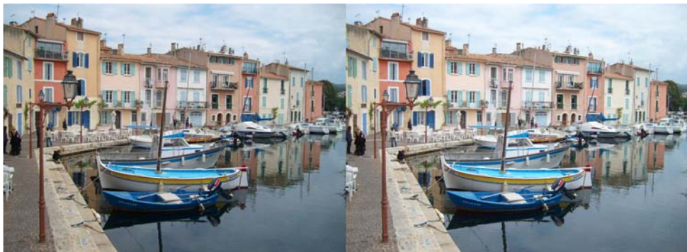
Dans le vieux port de Martigues - Photo : Jacques Sandillon

première partie pendant laquelle furent projetés des diaporamas sous-marins ainsi qu'un montage sur Tahiti de Bernard Rothan, puis une œuvre collective du SCF intitulée « Nature ». À cette issue, un entracte permettait aux représentants du SCF de monter sur scène pour donner quelques explications sur les techniques utilisées en photo stéréo.