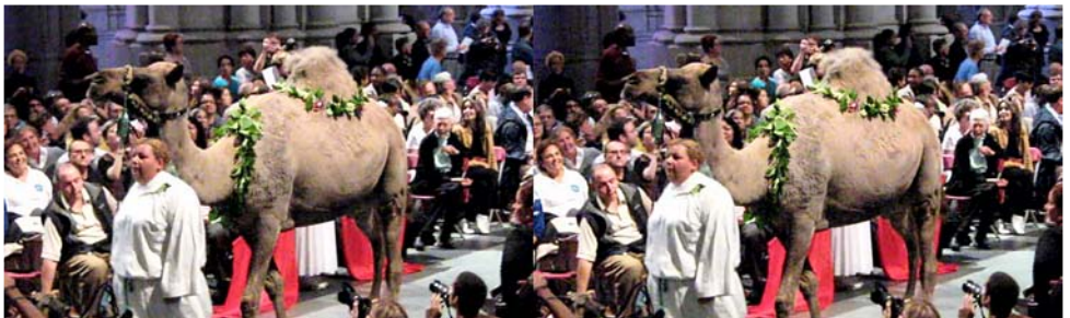
Un dromadaire dans une église ?!? Normal ! C'est la Bénédiction des Animaux à la cathédrale Saint François d'Assise à New-York !