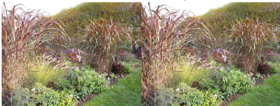
Au Jardin des Plantes