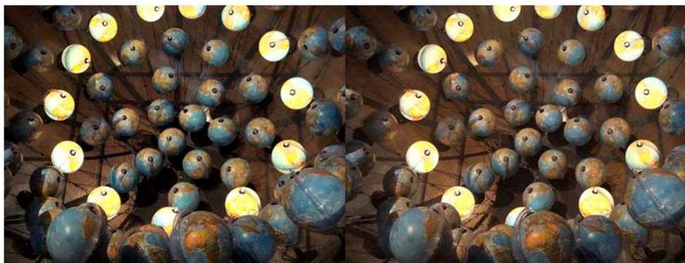
Une installation au Musée d'Art Moderne de Lisbonne