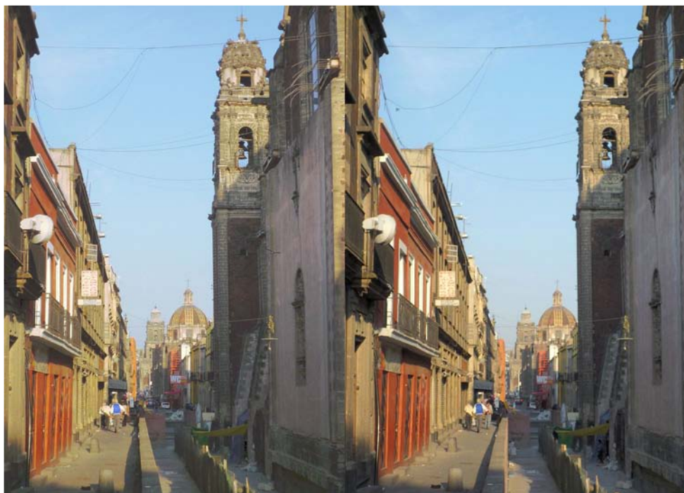
Calle Moneda, la rue de la monnaie dans le vieux centre de Mexico. Au premier plan, l'église Sainte Inès, puis l'église de la Sainte Trinité et, au fond, la grande cathédrale de Mexico. Position : 19°N 25' 58" 99°O 7' 34" Hyperstéréo en deux temps, Lumix FX 550 van Ekeren