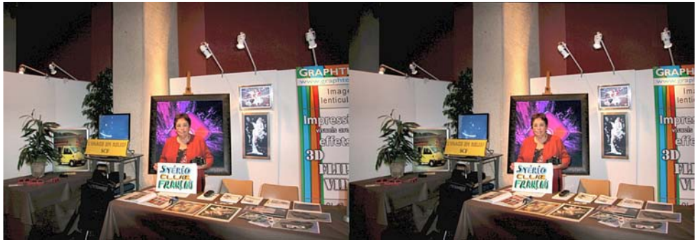
Le stand du SCF au Salon de la photo de Savigny-sur-Orge

Ce salon sur la photo en relief et la 3D s'est tenu du 12 au 16 mai 2010 dans la salle des fêtes.