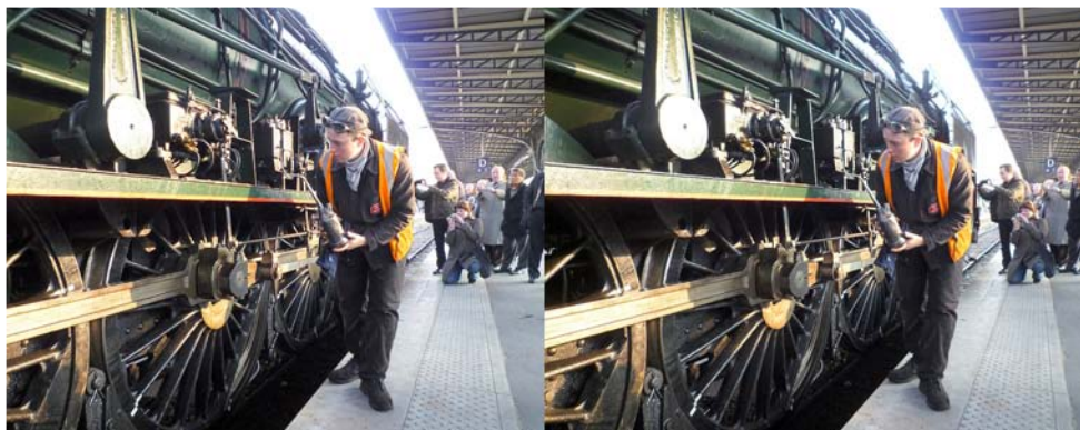
La vieille locomotive à vapeur 241P17 a besoin de soins attentifs !