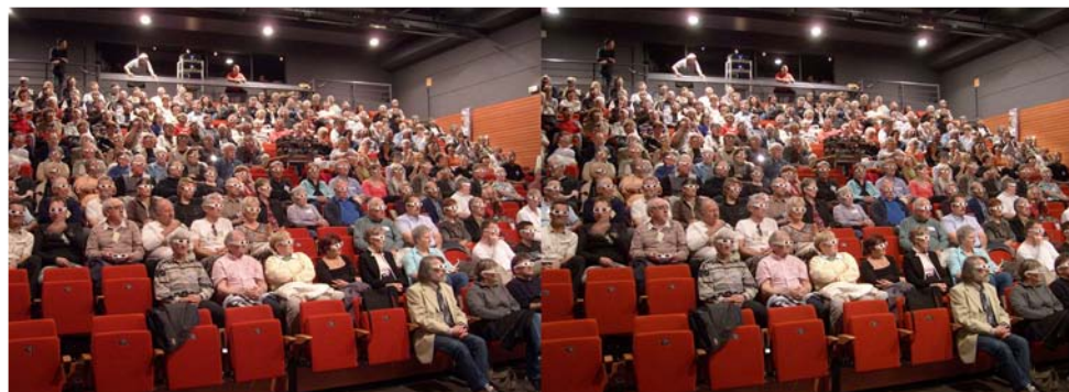
L'assistance du congrès FPF a bien apprécié la projection 3D du SCF