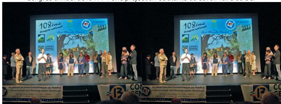
L'équipe du "Marius Photo Club", organisateur du congrès de la Fédé

Congrès annuel de la FPF : Une projection éclatante du savoir-faire du SCF