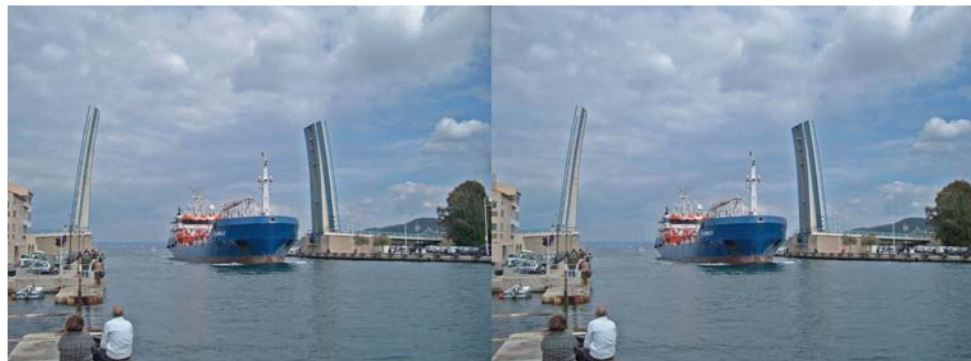
Entrée d'un navire cargo dans le port de Martigues

Note *) : Il y a aussi des solutions très économiques : toutes les photos de ce congrès on été faites avec un couple de Vivitar achetés en solde à 30€ pièce, montés sur une planchette de contreplaqué (cf. photo). Le déclenchement synchronisé étant assuré par le système dit « G.M.D. » : Gérard-Métron-Digital (marque non déposée) variante « M.J.S. » : Modifié-Jacques-Sandillon. Au sujet du « G.M.D. » vous reporter au bulletin SCF n°914, page 10. La variante « M.J.S. » consiste à inclure un retard de 2 secondes au déclenchement qui laisse le temps de stabiliser l'ensemble après avoir appuyé comme une brute sur les déclencheurs afin d'obtenir une simultanéité maximale. Sur les Vivitar en question l'option « G.M.D.M.J.S. » est incluse en standard.