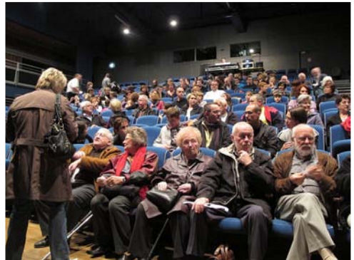
Florange - Lorraine - La salle