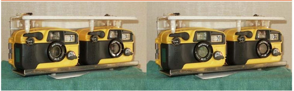
Support pour deux appareils étanches Sea&Sea synchronisés mécaniquement. Réalisation & Photo : Marcel Couchot