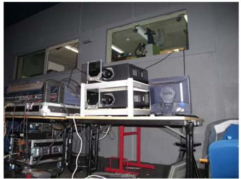
Florange - Lorraine Les deux projecteurs Panasonic en action