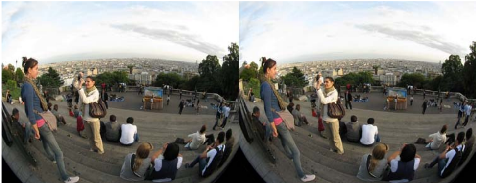
Touristes à Montmartre. Compléments fish-eye sur des Canon A570