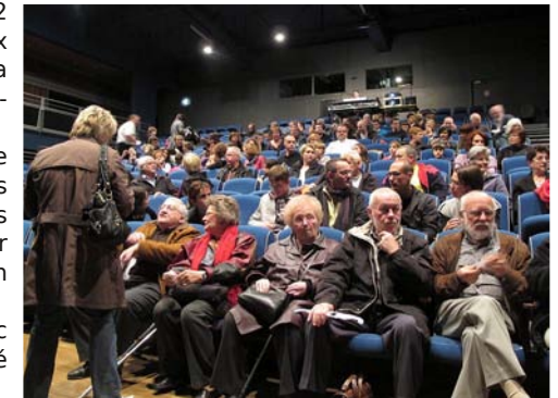
Florange - Lorraine - La salle