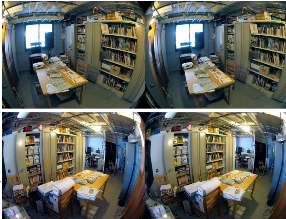
La bibliothèque du Stéréo-Club Français au Lorem