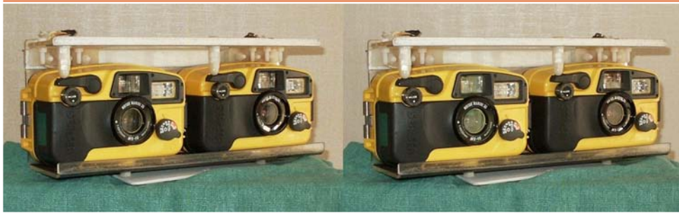
Support pour deux appareils étanches Sea&Sea synchronisés mécaniquement. Réalisation & Photo : Marcel Couchot