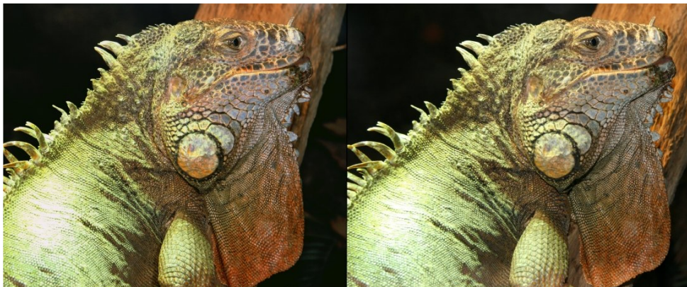
Iguane du Costa Rica : 2 reflex Canon côte à côte avec un peu de convergence

Bibliothèque (consultation des ouvrages et documents sur la stéréoscopie au Lorem) : Contactez Rolland Duchesne aux séances ou par mail.