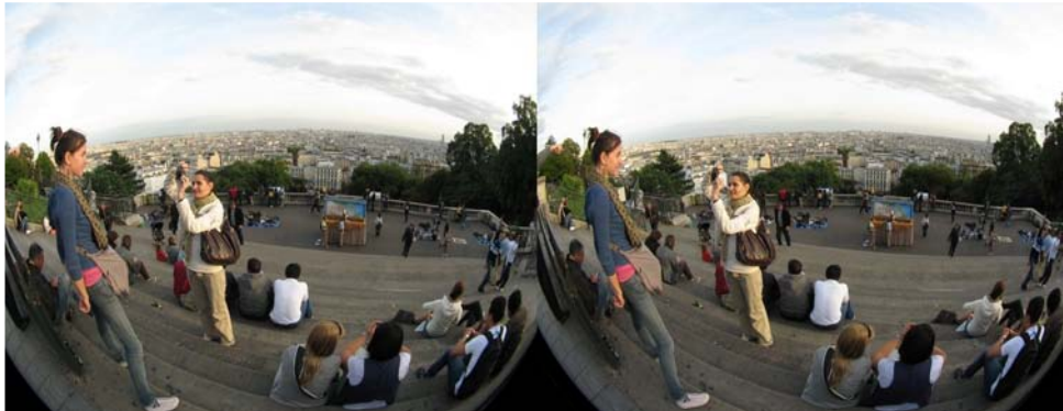
Touristes à Montmartre. Compléments fish-eye sur des Canon A570