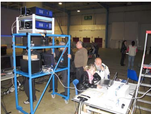
Busto Arsizio – Italie La technique de projection

Des applaudissements très chaleureux ont récompensé les efforts et le travail de prises de vues des photographes de l'équipe Team La Salle.