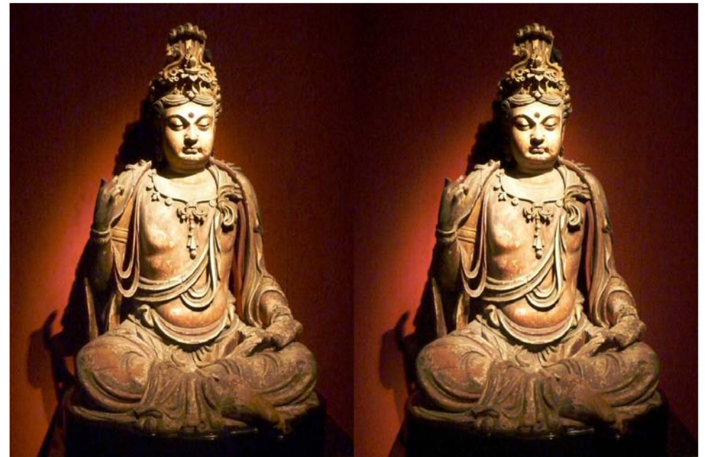
Sculpture au musée de Shanghai, République Populaire de Chine

Association pour l'image en relief fondée en 1903 par Benjamin Lihou