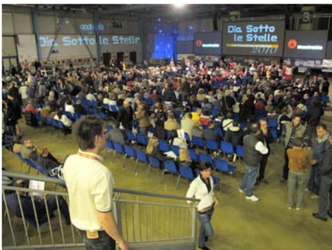
Busto Arsizio – Italie – La salle de projection

Lido Andrella a proposé aux photographes 3D de l'équipe internationale