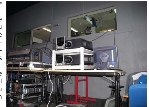
Florange - Lorraine Les deux projecteurs Panasonic en action