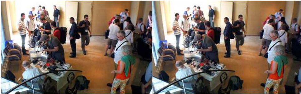
Une partie de la foire commerciale au congrès ISU 2013

La Trade Fair est une tradition des congrès ISU, cette foire commerciale (traduction imparfaite) est très attendue par les participants. Elle permet de trouver du matériel stéréoscopique peu courant, de tester sur place des choses dont on a entendu parler, de découvrir d'autres dont on ignorait l'existence et aussi à l'occasion de faire quelques emplettes !