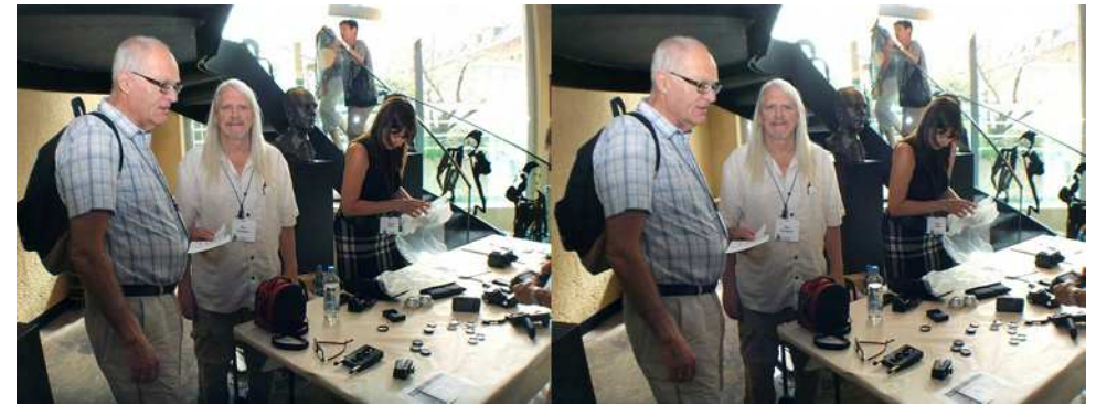
Le stand Cyclopital

View-Master et qu'on peut traduire par « voit-plus-large » !). Il existait déjà un modèle, le « Cyclopital3D Digital Stereoscope » (voir Lettre n°922, p.19 & n°923, p.8) mais il était peu convainquant du fait de la faible résolution des écrans utilisés (800x480 pixels) malgré des oculaires de qualité offrant un bon champ de vision. Le nouveau modèle se différencie essentiellement par le remplacement des deux écrans par un téléphone portable à écran HD 5 pouces de diagonale. Il présente un certain nombre d'avantages par rapport au modèle précédent : encombrement et poids réduit (626 g) du fait de la suppression des miroirs internes, gestion des images facilitée (le premier modèle utilisait deux cartes mémoire séparées), meilleure résolution (avec un téléphone à écran HD, le gain est de x2,7 par œil), possibilité de jouer des vidéos, possibilité d'accéder à des galeries en ligne