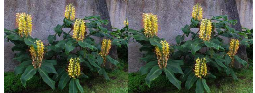
Plante mystère, photo 1