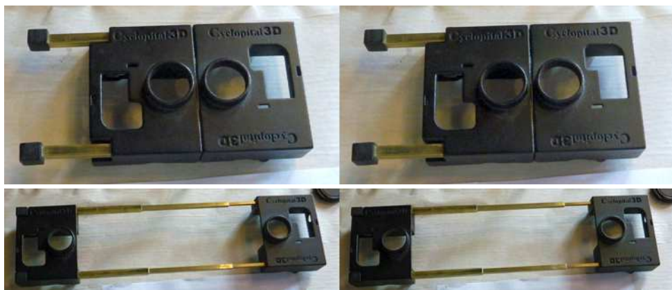
Prototype Cycloptical de monture à base ajustable pour deux caméras GoPro