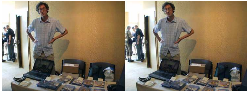
Hermann Miller et ses films Blu-ray 3D

Werner partage son stand avec un autre allemand Hans-Joachim Rietscher de la société RealVision 3D qui vend des produits pour la projection polarisée : lunettes, polariseurs et toile d'écran en trois granularités. http://www.rv-3d.de