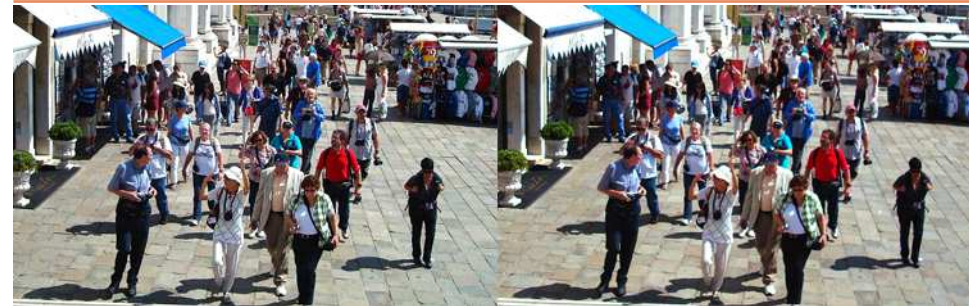
Congrès ISU : Suivez la guide ! Visite de Venise - Photo : Olivier Cahen