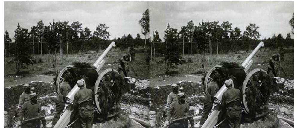
Batterie d'artillerie