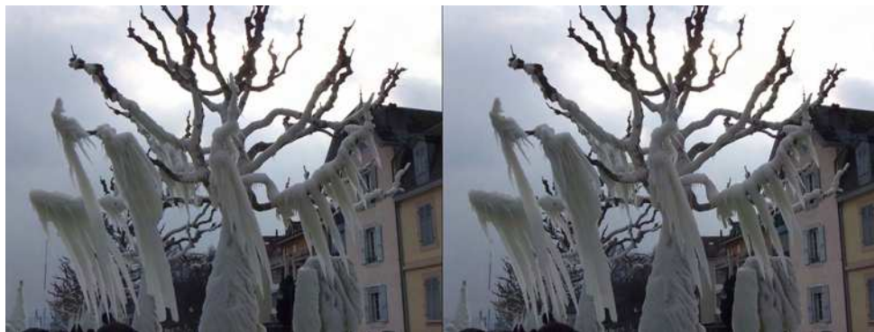
Bise Glaciale, arbres couverts de glace à Genève

Nous avons eu un problème technique en mai dernier avec l'ordinateur de projec-