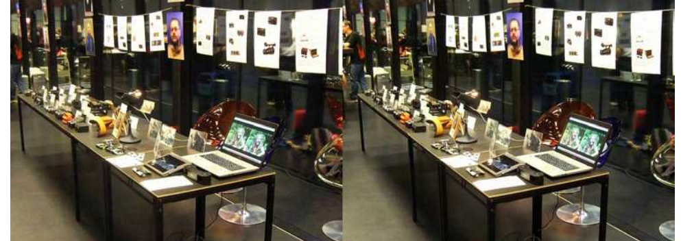
Romont, le stand de l'équipe franco-suisse