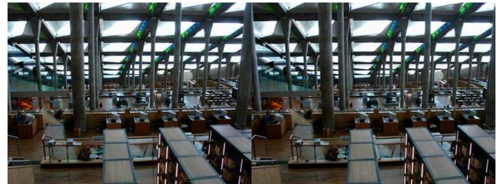
Salle de lecture de la nouvelle bibliothèque d'Alexandrie (Égypte)