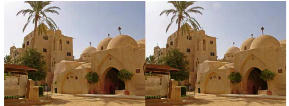
Monastère copte de Wadi Natrum (Égypte)