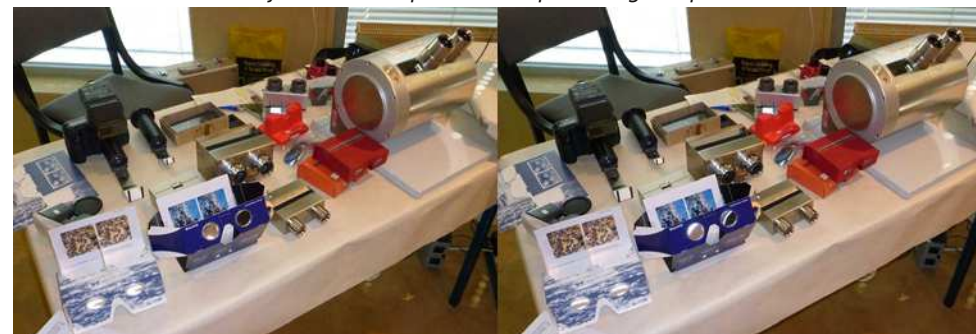
Stand De Wijs : visionneuses, stéréoscopes et objectifs macro