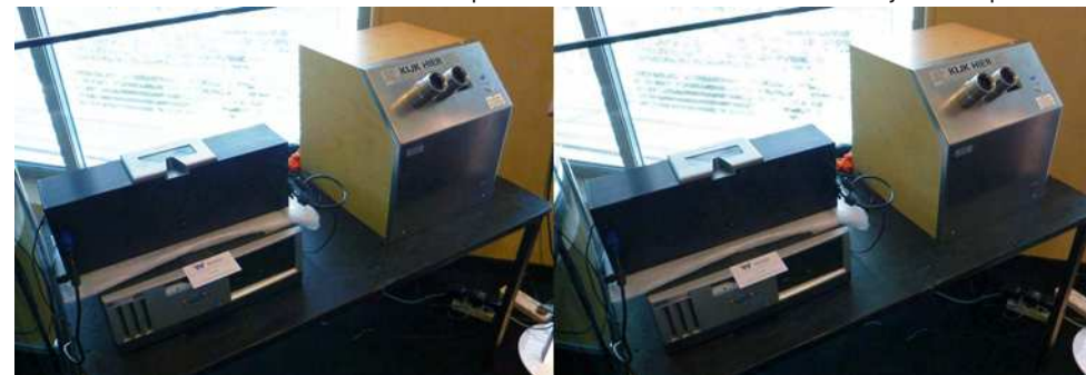
Stand De Wijs : stéréoscopes numérique et argentique