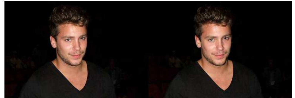
Romont : Bastian Baker, auteur-compositeur-interprète suisse