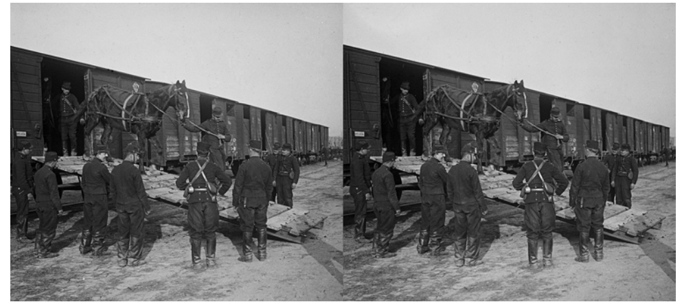
Débarquement du matériel