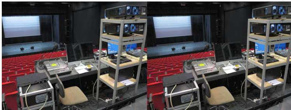
La régie son et projection à Romont (Suisse)