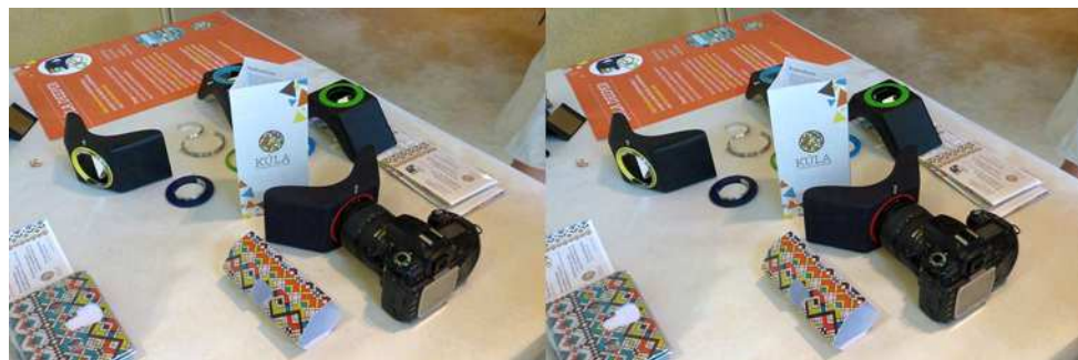
Adaptateur 3D "Kúla Deeper" (Islande)