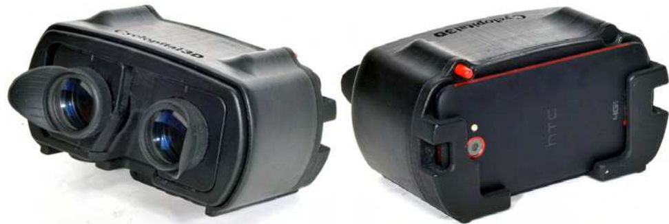
Le stéréoscope numérique Cycloptical HD3D View-Vaster - © Cycloptical

d'images et de vidéos (YouTube par exemple). À 450 $US le prix est aussi à la baisse mais ne comprend bien sûr pas le téléphone ! Le site web liste les téléphones compatibles, à noter que les téléphones iPhone d'Apple n'ont pas d'écrans HD et ne sont donc pas recommandés. Le stéréoscope est livré avec un berceau correspondant à un modèle précis de téléphone ; ce berceau est démontable et peut donc être remplacé en cas de changement de téléphone. L'avantage d'assister au congrès est de pouvoir tester soi-même le matériel ! L'appareil est bien conçu avec une bonne prise en main, les oculaires offrent un champ de 43°, sont réglables en écartement et disposent d'une bonne plage de mise au point. On a une bonne présence d'image, l'image est sans fantôme, lumineuse et contrastée malgré la petite ouverture au bas de l'écran,