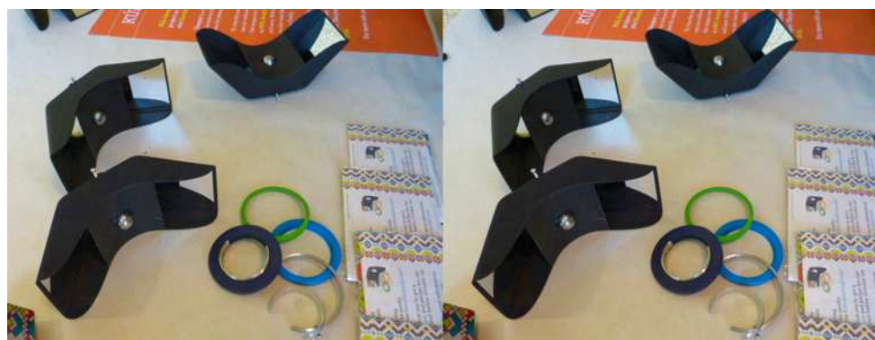
Détail de l'adaptateur 3D "Kúla Deeper" (Islande)

Montons d'un étage où nous découvrons quatre stands. Juste en haut des marches nous trouvons les De Wijs (Pays-Bas), le père Hugo et le fils Jeroen ( http://www.dewijs-3d.com ). À côté des classiques et impeccables stéréoscopes motorisés présentant un carrousel de dix diapos et destinés aux musées et expositions, le stand expose plusieurs nouveaux modèles numériques à simple écran LCD partagé ou double écran + miroirs de type Wheatstone. Modèle à écran unique :