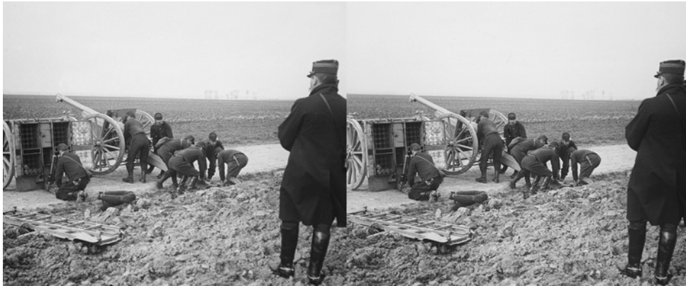
Batterie d'artillerie et lunette de visée