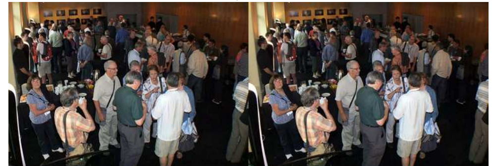
Rafraîchissements et discussions entre deux séances de projection