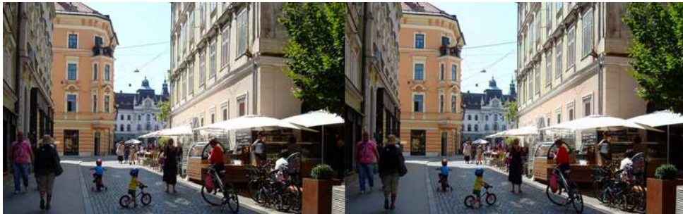
Promenade dans les rues piétonnes de Ljubljana - Photo : Olivier Cahen

Bibliothèque (consultation des ouvrages et documents sur la stéréoscopie au Lorem) : Contactez Rolland Duchesne aux séances ou par mail.