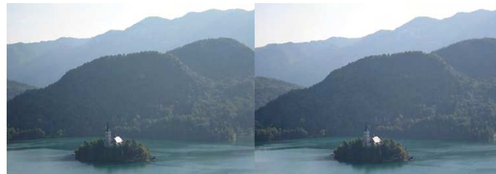
Congrès ISU : Vue du château, la petite ile et son église sur le lac de Bled