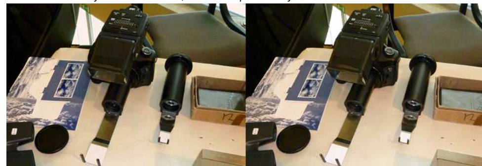
Stand De Wijs : objectifs macro 3D pour appareil réflex numérique