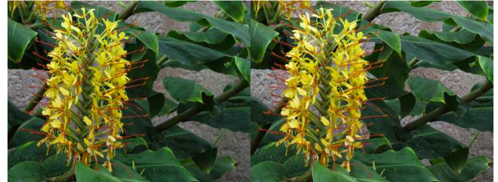
Plante mystère, photo 2