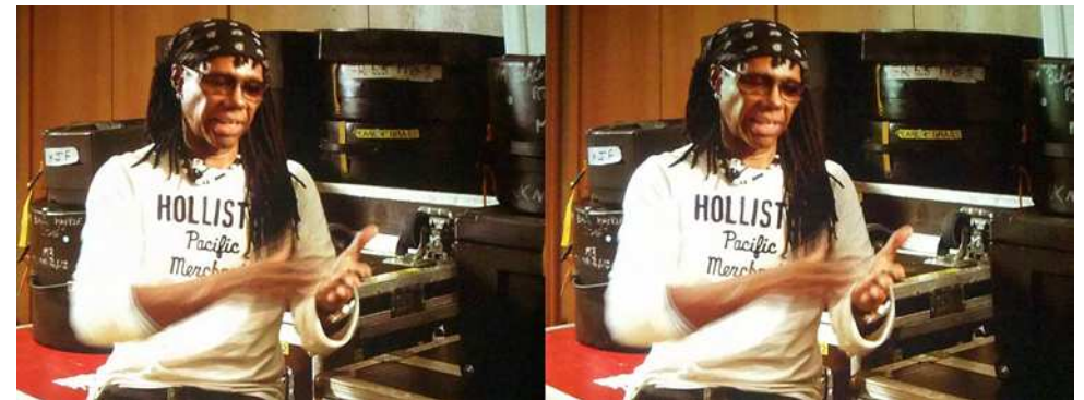
Chic's Nile Rodgers (image prise pendant la projection du film)