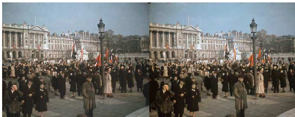
Place de la Concorde