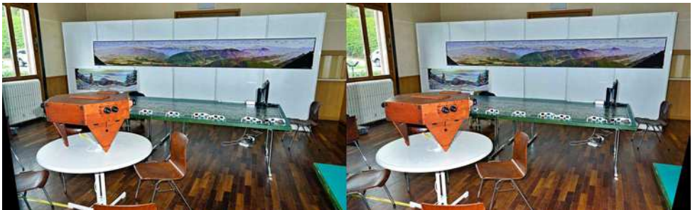
Mini Kaizerpanorama de Didier Chatellard et panoramiques anaglyphes de Pierre Gidon