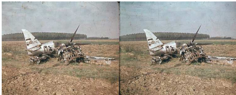
Restes de l'avion abattu