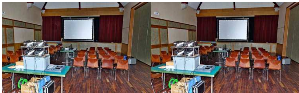
Tout est prêt dans la salle de projection