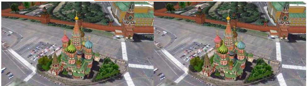
La cathédrale Basile-le-Bienheureux et le Kremlin se situent à ... Moscou !

Note : ma nouvelle adresse : lemennstereo@lemenn.fr