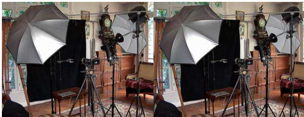
Studio de prise de vue installé dans le salon