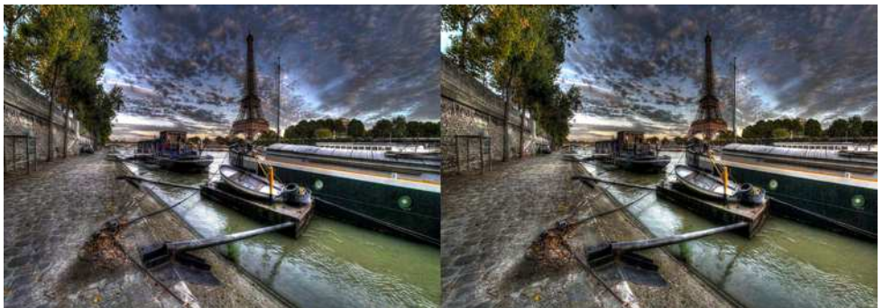
Vue sur la Seine et la Tour Eiffel depuis le Port Debilly à Paris. Double Panasonic GX1 + objectifs fish-eye diagonaux Samyang, base stéréo = 20 cm

Bibliothèque (consultation des ouvrages et documents sur la stéréoscopie au Lorem) : Contactez Rolland Duchesne aux séances ou par mail.