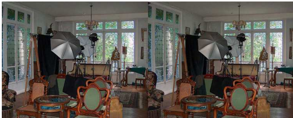
Studio de prise de vue installé dans le salon - Photo : Rolland Duchesne & Gérard Métron