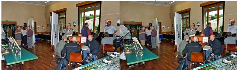
C'est le coup de feu, il y a du monde partout !

ajouté un diaporama muet sur écran Zalmán à côté des anaglyphes panoramiques de plusieurs mètres carrés de surface.