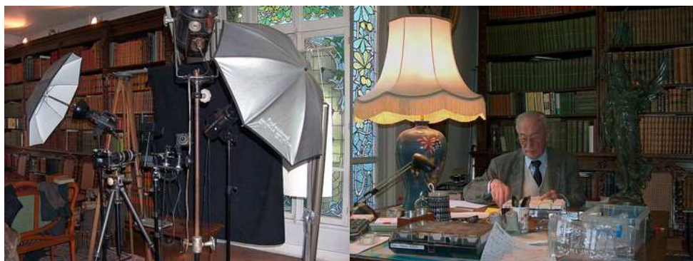
Matériel pour la prise de vue en relief.