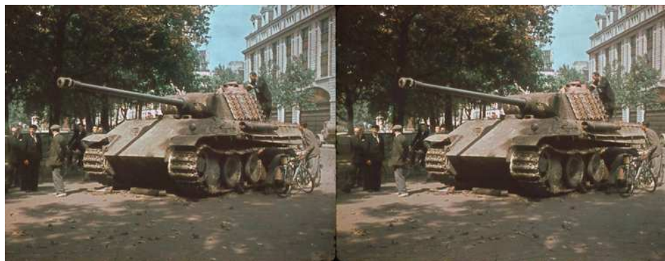
Char d'assault abandonné