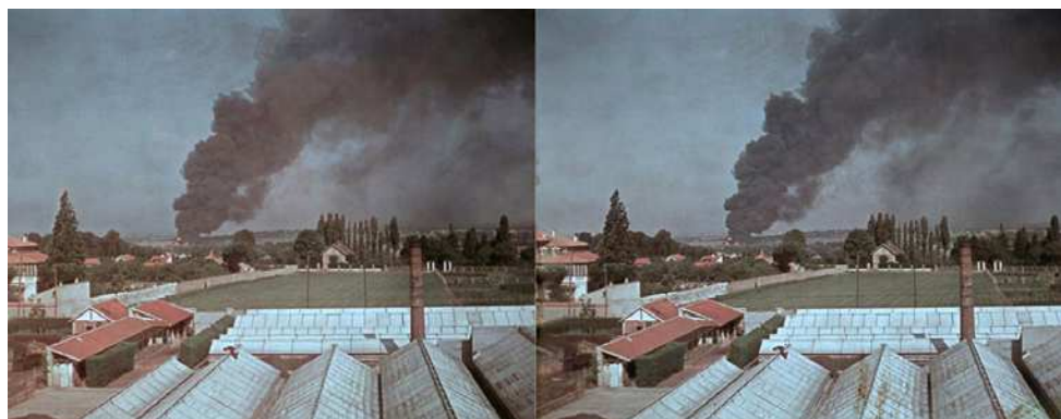
Un avion vient de s'écraser non loin des serres