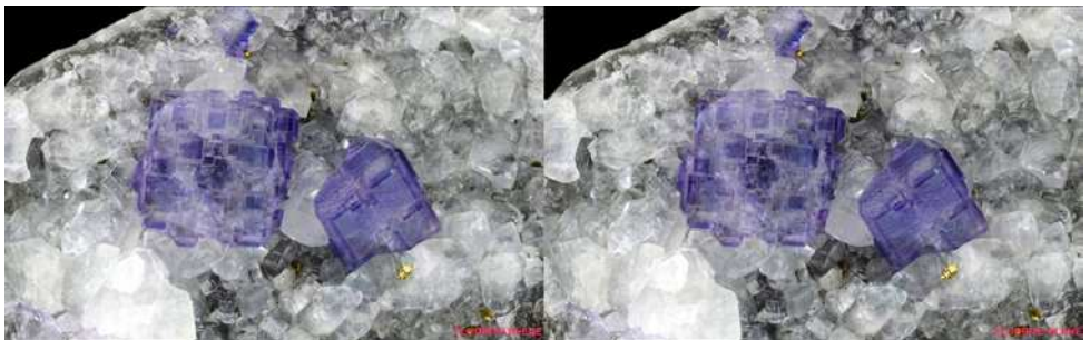
Microminéraux : Fluorite bleue