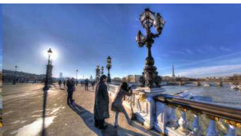
Pont Alexandre III à Paris