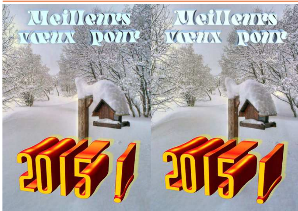
Bonne Année 2015 ! - Photo : Pierre Meindre

Association pour l'image en relief fondée en 1903 par Benjamin Lihou