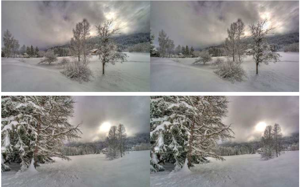
L'hiver dans les Alpes (Cordon, Haute-Savoie)

Stéréo-Club Français Association pour l'image en relief fondée en 1903 par Benjamin Lihou