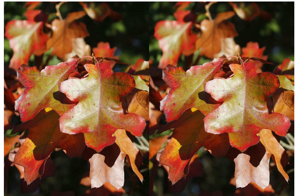
Chêne des teinturiers.

Association pour l'image en relief fondée en 1903 par Benjamin Lihou