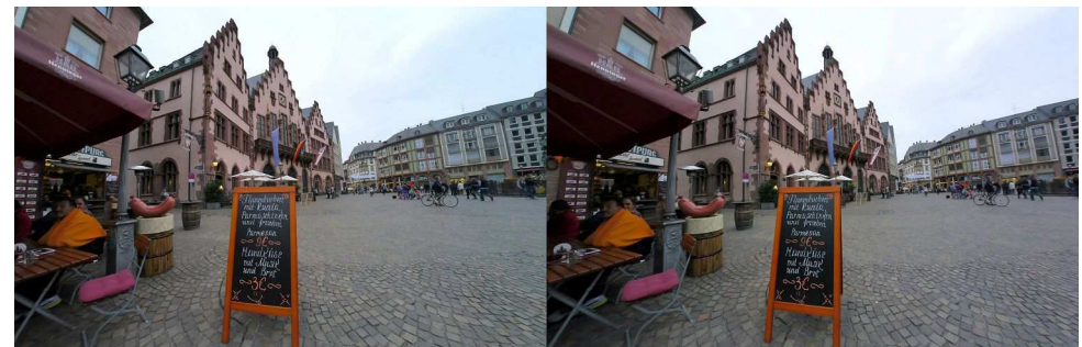
Le Römerberg est la place centrale du quartier médiéval de Francfort-sur-le-Main. On y trouve des restaurants touristiques qui proposent sur leur carte un intrigant "Handkäse mit Musik" - Photo : Pierre Meindre - https://fr.wikipedia.org/wiki/R%C3%B6merberg_%28Francfort%29

https://en.wikipedia.org/wiki/Handk%C3%A4se