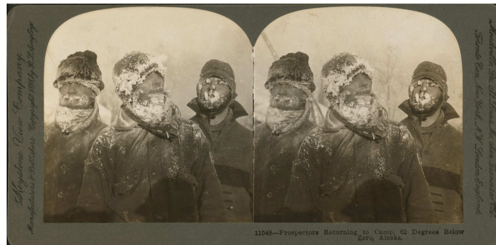
Prospecteurs de retour au camp par -62°F (-52°C), Alaska - Carte stéréo Keystone View Company, 1898 - Collection de la New-York Public Library.

http://digitalcollections.nypl.org/items/510d47e0-2bb4-a3d9-e040-e00a18064a99