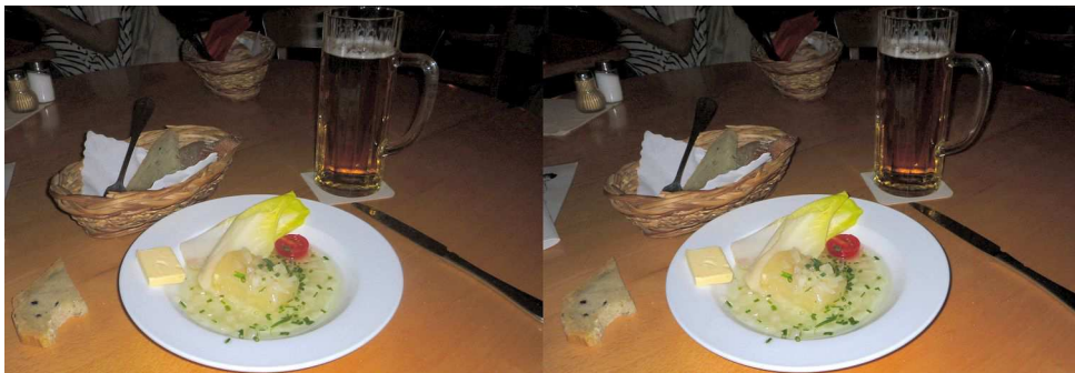
Une autre assiette de "Handkäse mit Musik", celle-ci servie au restaurant Metropol Kaffeehaus am Dom près de la cathédrale de Francfort

Stéréo-Club Français Association pour l'image en relief fondée en 1903 par Benjamin Lihou