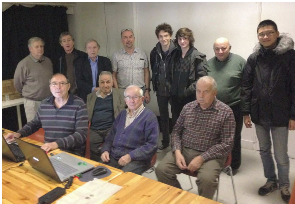
Séance du 20 janvier 2016 au Lorem, les lycéens avec quelques membres du Club.