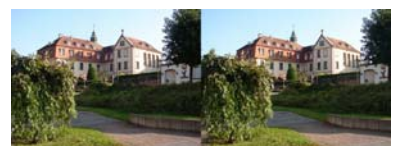
3 1 ère image